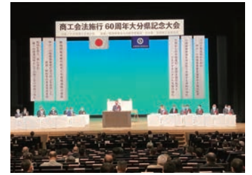
商工会法施行60周年大分県記念大会