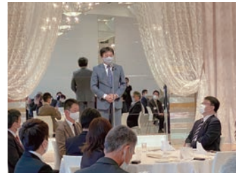
UAゼンセン大分県支部 第9回定期総会レセプション