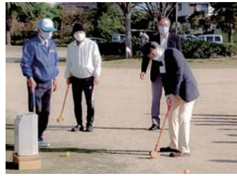
第28回 戸次体協秋季 グラウンド・ゴルフ大会